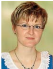
Projektleitung: Sabine Poier